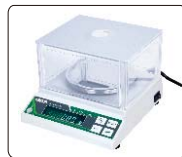
防风罩 (8301-300-C, 8301-600-C, 8301-1200-C标配)