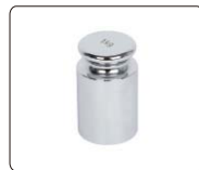
校准砝码 (8301-300-C, 8301-600-C, 8301-1200-C标配)